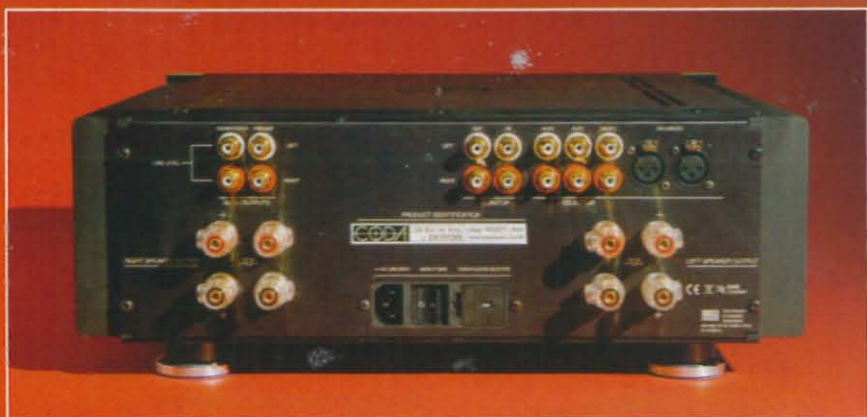
La face arrière permet d'admirer les beaux borniers dorés doublés destinés à accueillir les câbles HP et d'apprécier la présence d'une sortie subwoofer.